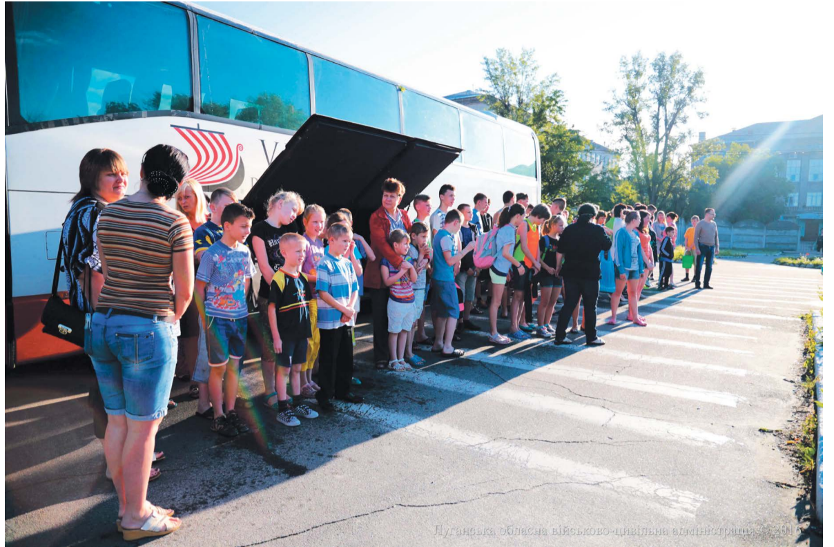
Луганська обласна військово-цивільна адміністрація

Официальный старт нынешней оздоровительной кампании начался 1 июня, но уже в феврале дети с Луганщины проходили оздоровление во Всеукраинском лагере «Молодая гвардия» (Одесская обл.). Мальчишки и девчонки из Станично-Луганского района отдохнули в лагере «Лесная застава» (Киевская обл.). Совсем недавно, 28 мая, группа из 48 человек отправилась на отдых и оздоровление в Одессу. В первых числах июня дети из Счастья бу-