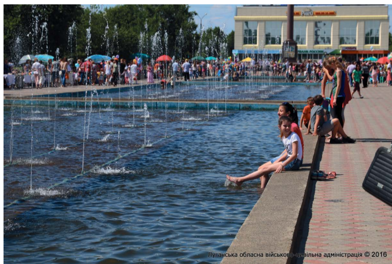
Луганська обласна військово-цивільна адміністрація © 2016