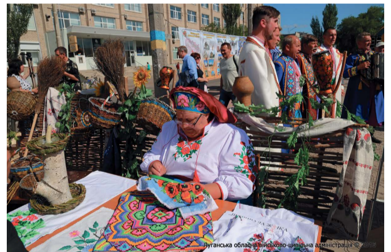
Луганська обласна військово-цивільна адміністрація © 2016