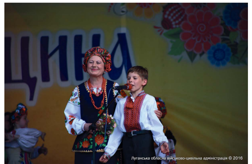
Луганська обласна військово-цивільна адміністрація © 2016

В Северодонецьку святкували 78-му річницю утворення Луганщини з великим розмахом, а урочисті заходи тишили своїм різноманіттям