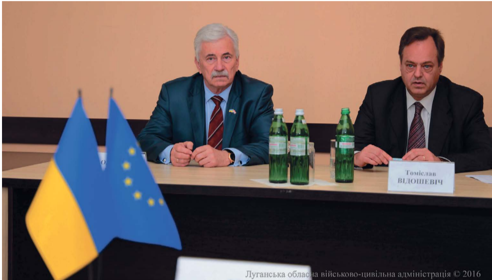
Луганська обласна військово-цивільна адміністрація © 2016