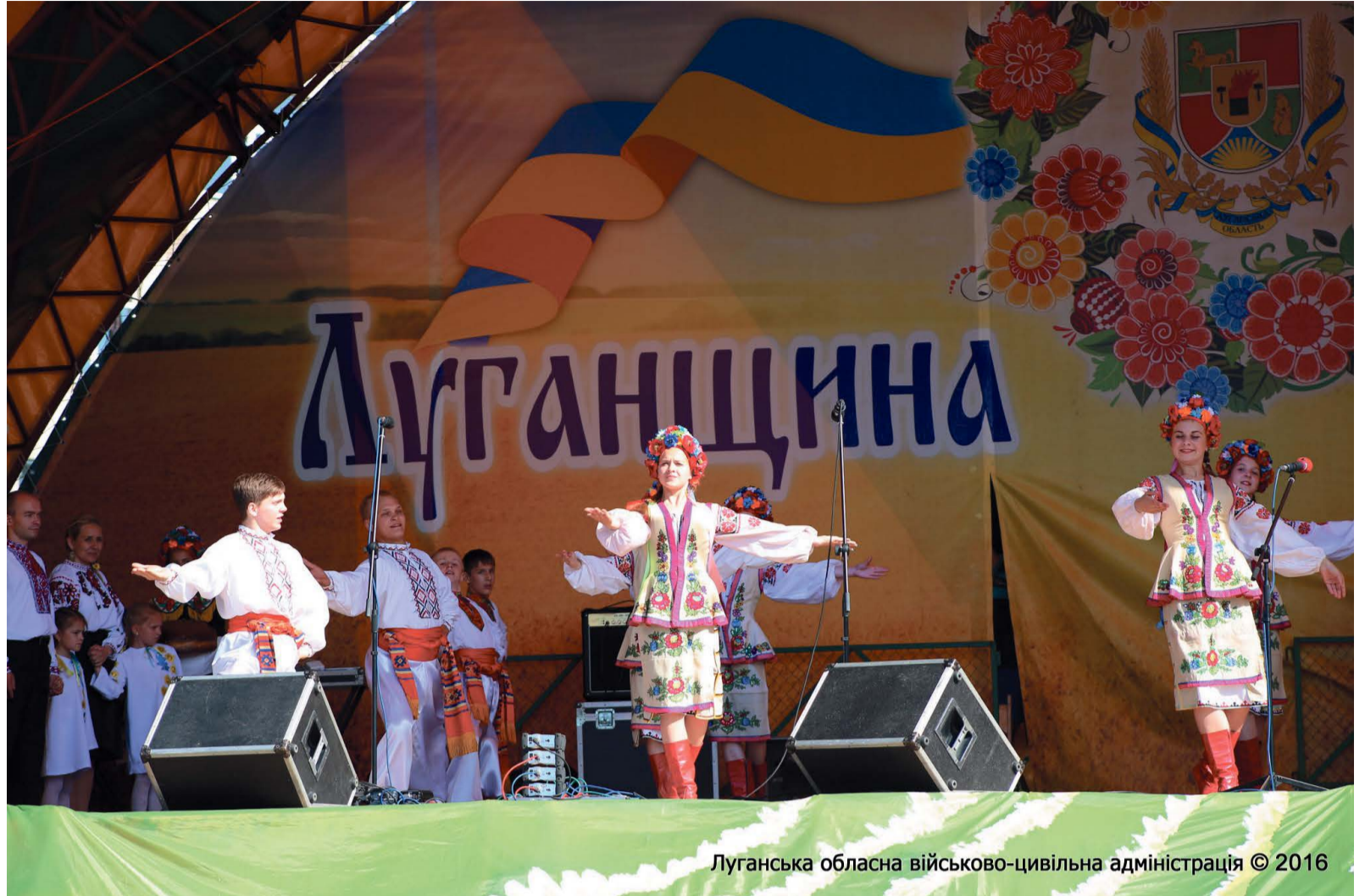
Луганська обласна військово-цивільна адміністрація © 2016