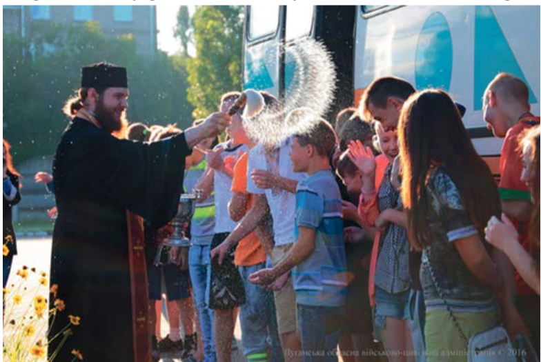
Луганська обласна військово-цивільна адміністрація

рубежных) не менее 95% детей, нуждающихся в этом и попадающих под действие ЗУ «Об оздоровлении детей». К сожалению, в связи с началом АТО на востоке Украины появились определенные трудности в проведении летних оздоровительных кампаний.