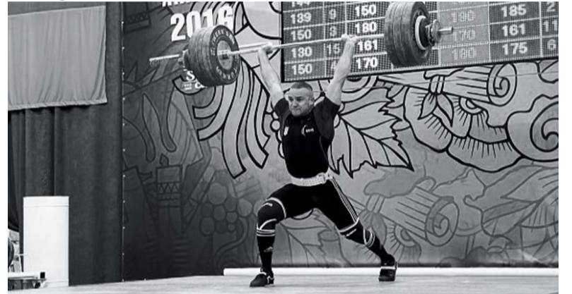
НАШ ВАЖКОАТЛЕТ ВСТАНОВИВ РЕКОРД УКРАЇНИ

До цього рекорд змагань належав італійкам. 27 липня 1988 року вони пробігли за 43,96 с.