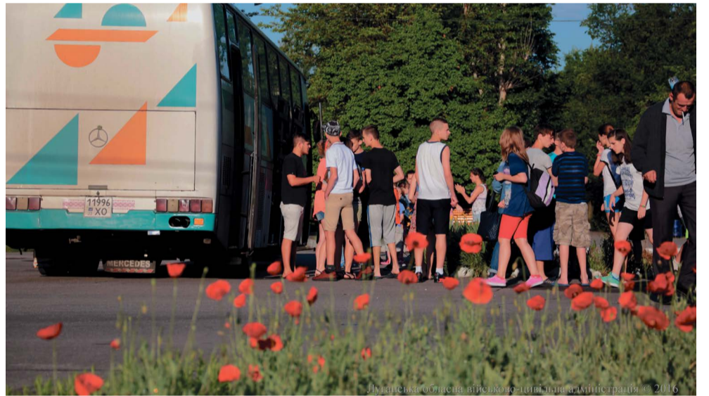
Луганська обласна військово-цивільна адміністрація © 2016