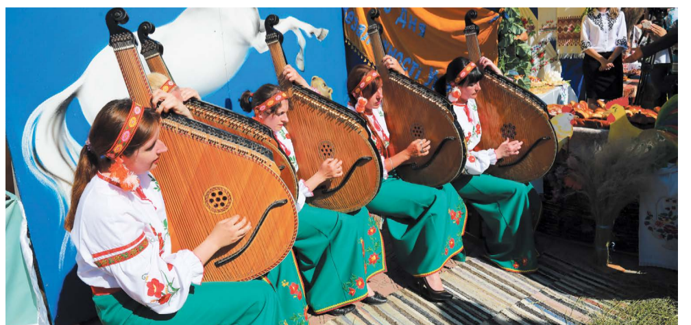
Дні Луганщини 8 ст.