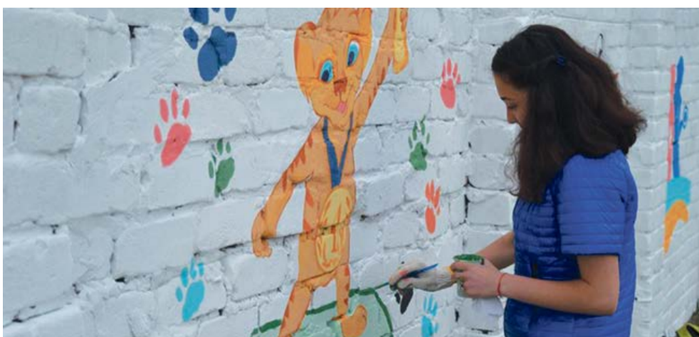
Обласний конкурс малюнків 8 ст.